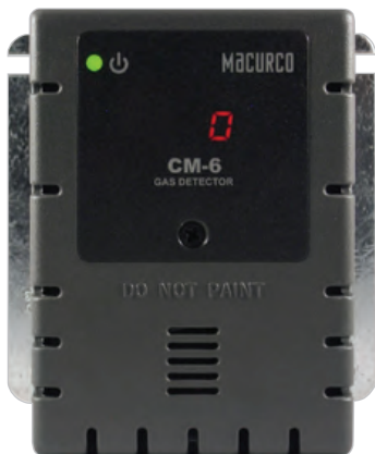
Carcasa gris (estándar)