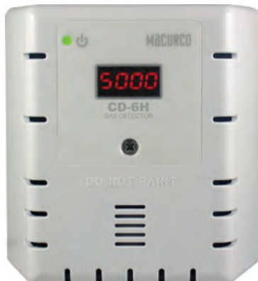
Opción de carcasa blanca

Los detectores de gas fijos Macurco Serie 6 y 12 brindan soluciones que salvan vidas y ayudan a proteger a las personas y las propiedades. Estos detectores de gas fijos están diseñados para la detección, mitigación y notificación de niveles bajos. Deje que estos detectores hagan el trabajo por usted cerrando válvulas, encendiendo ventiladores, activando bocinas y luces estroboscópicas, y notificando a los paneles de incendios y sistemas de automatización de edificios cuando los gases alcanzan límites clave.