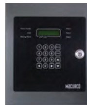
Paneles de Control