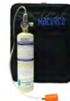
Kits de calibración