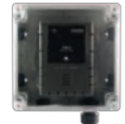
Kit de carcasa resistente a la intemperie (El detector se vende por separado)