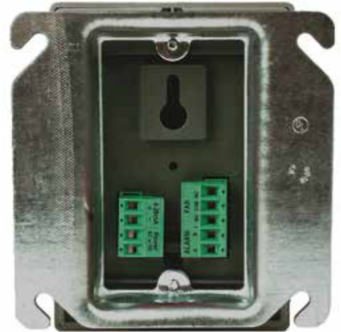
CM-6 Vista Trasera